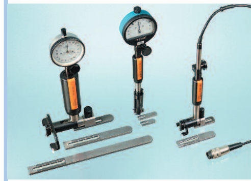
SUBITO® SS für Grundlochbohrungen

Die Feineinstellung kann mittels Einstellringen, Meisterstücken oder dem Einstellgerät ESU mit Spezial-Einstellbacken für das SS erfolgen.